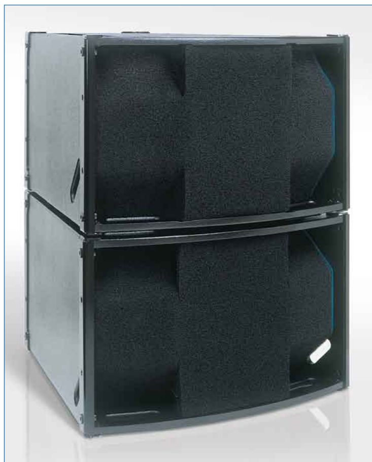
Un système APG4000 : une enceinte 4000HI et une enceinte 4000LO

L'ensemble technologique MATRIX ARRAY APG est composé des systèmes APG4000 et APG6000.